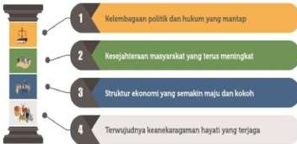
Gambar 3.1. Empat Pilar RPJMN IV tahun 2020 - 2024

Rencana Pembangunan Jangka Menengah Nasional (RPJMN) 2020-2024 merupakan tahapan terakhir dari Rencana Pembangunan Jangka Panjang Nasional (RPJPN) 2005-2025. Terdapat 4 (empat) pilar dari RPJMN 2020-2024 untuk mencapai tujuan utama dari rencana pembangunan nasional periode terakhir, yaitu: